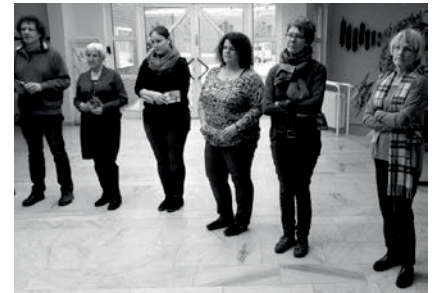
Teilnehmende bei der Ergebnissicherung

2017 liegt der Akzent der CKD-Kampagne mit dem programmatischen Motto „ZusammenLeben - gemeinsam sind wir Heimat“ auf dem Spannungsfeld ‚offene Gesellschaft und Heimat‘. In den Workshops wurden die Teilnehmenden angeregt zu fragen, was Heimat, Heimatverlust oder „zweite Heimat“ für sie bedeutet und wie Heimat für sie entsteht.