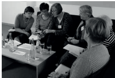
Arbeitsgruppe während des Workshops

Die Vorstellung, mit Schnellbooten den Kurs in die Zukunft zu bestimmen war für manche ehrenamtliche Vorstände und hauptamtliche Geschäftsführer(innen) der Diözesanverbände der CKD - dem Netzwerk von Ehrenamtlichen ungewohnt. Für 38 Teilnehmende ging es am 17. und 18.03.2017 in einem CKD-Workshop in Bensberg darum, diesen zirkulären Ansatz auszuprobieren.